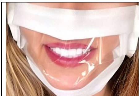
Esempio di mascherina da utilizzare